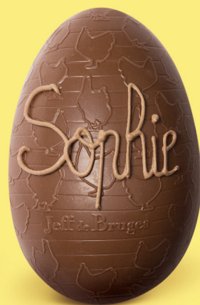
Chocolat au lait