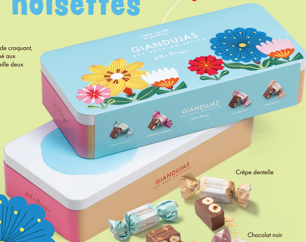
Chocolat au lait